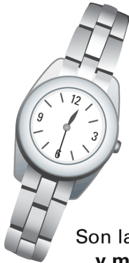
Son las doce y media .