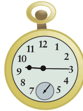
Son las nueve y quince .